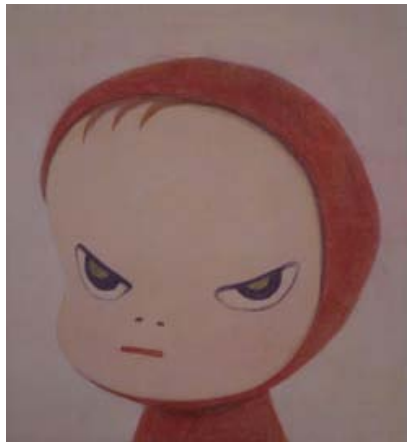
奈良美智 小红帽 1997年(C)Japan Foundation

本次日本国际交流基金会与清华大学美术学院、驻华日本大使馆、清华大学日本研究中心共同举办的“绘画嘉年华：90年代的日本绘画”展是一次尝试，本展试图展示在信息通讯手段高速发展的20世纪末，日本的新一代艺术家们是如何尝试以各自独到的表现方式，来展示并解析“绘画”这一艺术形式的。绘画在当今日新月异的世界变幻中发挥着怎样的作用？在艺术界又起到何种作用？这是日本，乃至全世界共同面对的一大课题。