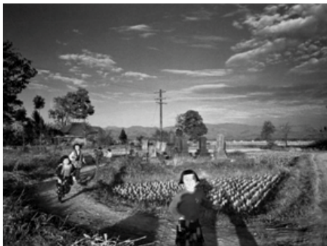
千叶禎介《夕下时分，平鹿郡》1958年

2011年3月11日侵袭日本东部的大地震给日本东北地区带来了巨大的灾难。媒体提供的照片及影像迅速在全世界流传，为了灾后重建的尽快开展而进行的支援与协助活动的范围扩大——对此我们的记忆仍然鲜活。由日本国际交流基金会策划的本次摄影展，是要通过著名摄影师的作品呈现日本东北部的风土、人以及生活并将之介绍给世界。本展由与日本东北部有着渊源的10位著名摄影师的作品构成。既有20世纪40年代的老照片，也有当下拍摄的作品。将让全世界的观者体验贯穿过去·现在·未来，独具个性的摄影师们视角下的日本东北地区的深厚魅力。展览向世人展示了地震后日本民众对于“何为日本人”问题的重新思考。旨在以日本为鉴，令全世界人民共同重新思考“什么是生活”等问题。为了让世界了解日本东北部地区，让我们共同探讨“地球的未来何在”提供了一次契机。