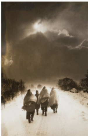
小岛一郎《津轻市稻垣市一带》1960年

【展期】2012年3月10日（周六）--3月16日（周五）（9:00--17:00周一闭馆）