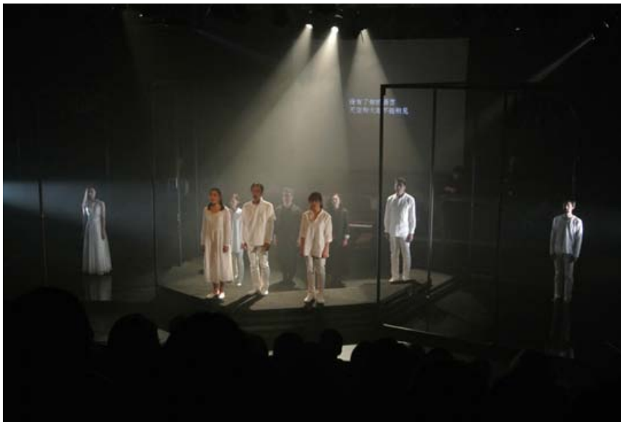
(《祝/言》 @上海话剧艺术中心 上海ACT2013)

具体介绍请参考本中心官方豆瓣小站: http://www.douban.com/event/20532964/