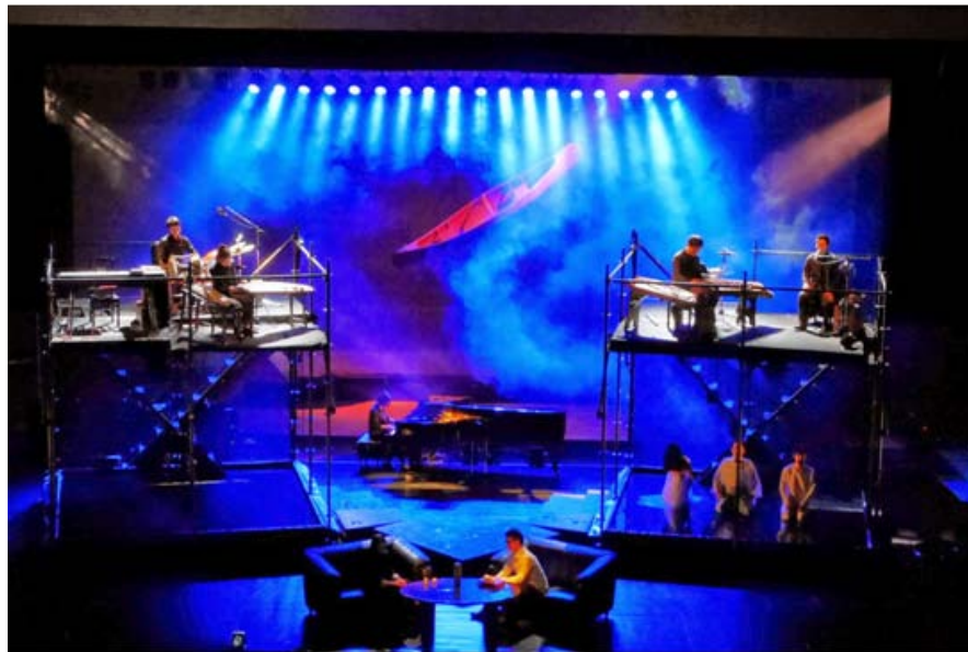
(《祝/言》 @东京新国立剧场小剧场 FIT13)